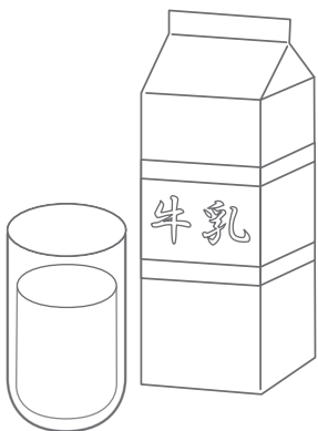
ぎゅうにゅう, ミルク